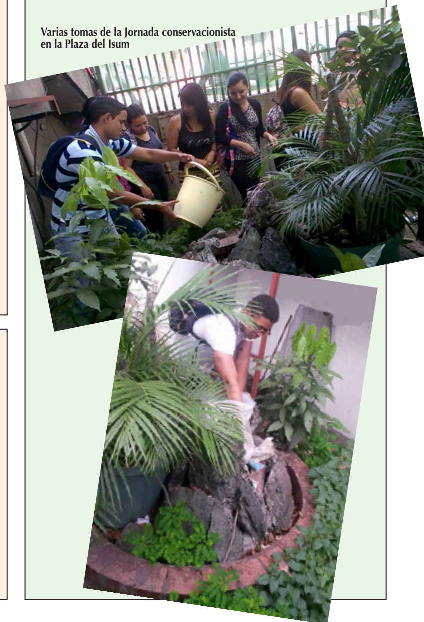
Varias tomas de la Jornada conservacionista en la Plaza del Isum

Instituto Universitario de Mercadotecnia - ISUM